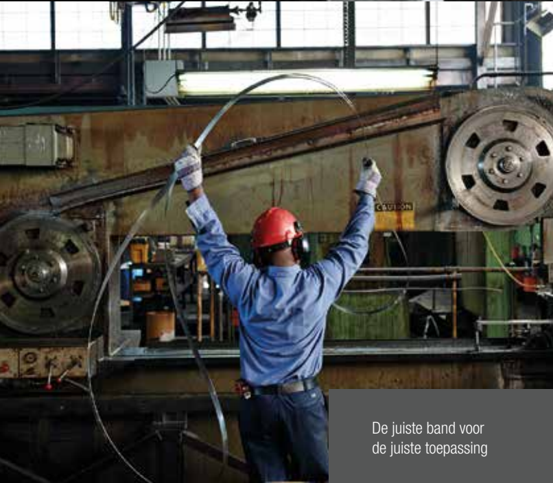
De juiste band voor de juiste toepassing