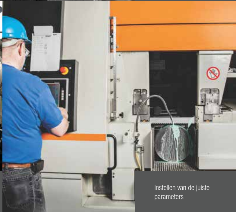
Instellen van de juiste parameters