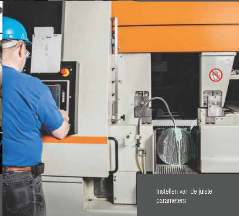
Instellen van de juiste parameters