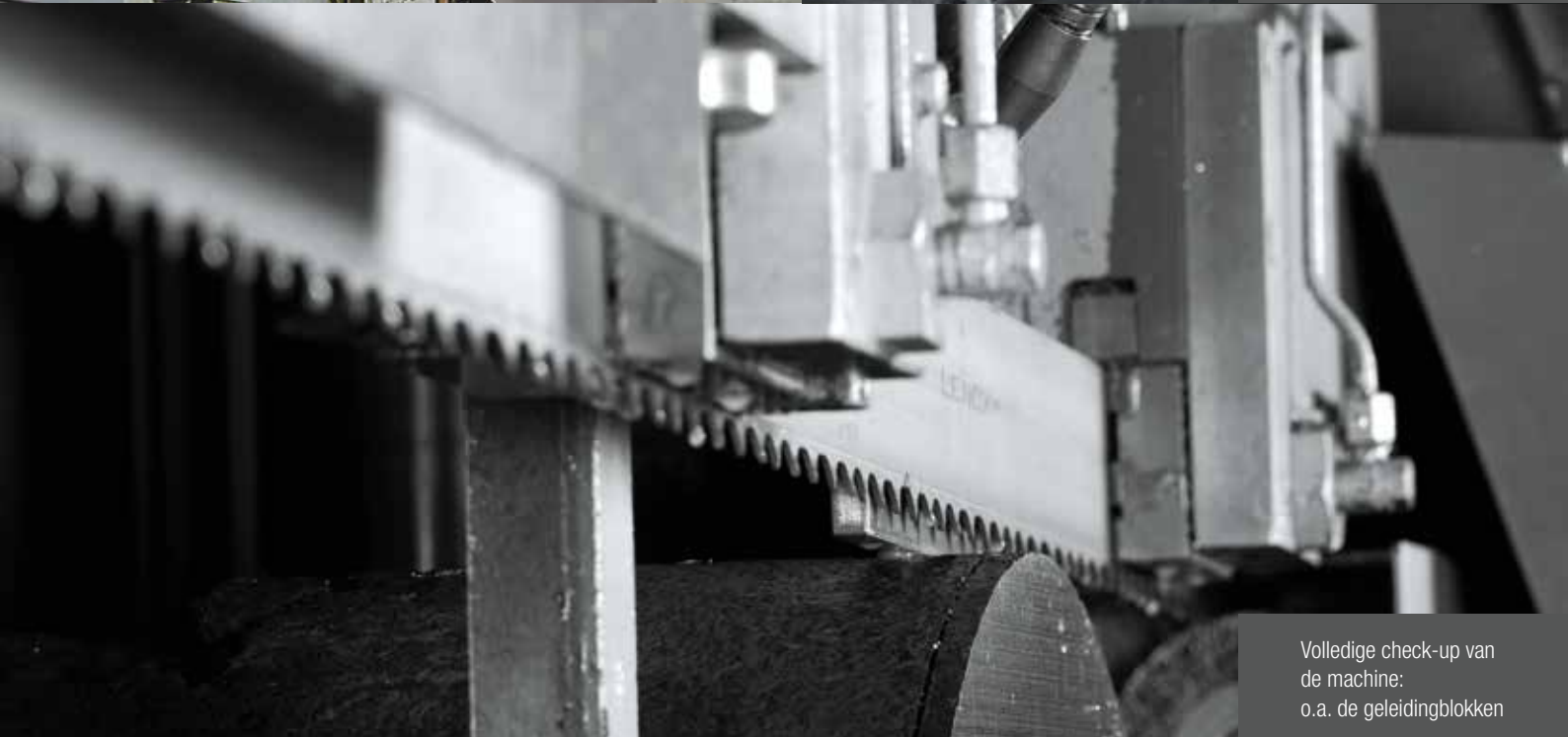
Volledige check-up van de machine: o.a. de geleidingblokken