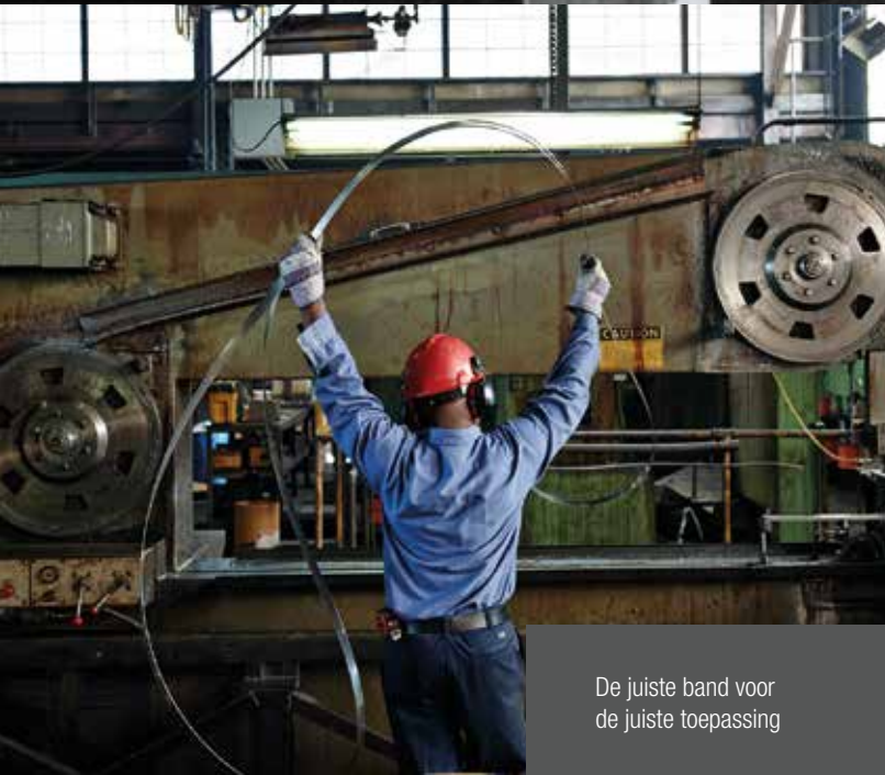
De juiste band voor de juiste toepassing